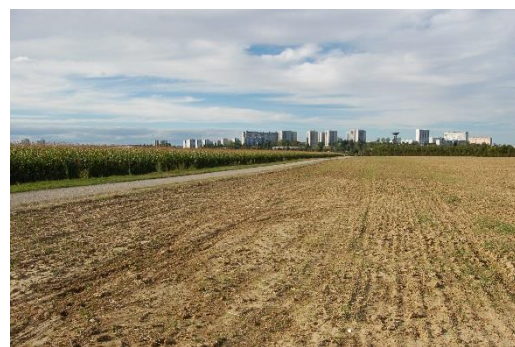
Figure n° 1. Les grandes terres (Grand Lyon)

Aussi, le projet cherche à développer des descriptions et des perspectives à la fois plus réalistes et plus originales des formes d'hybridations dans ces domaines, et des voies qu'elles tracent pour éclairer la décision publique et l'action des acteurs de terrain.